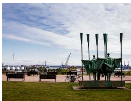
Der Altonaer Balkon, von dem man über den Hafen blickt.

Von dort hat man einen fantastischen Blick auf das Wichtigste von Hamburg: den Hafen. Vorn fließt die Elbe Richtung Nordsee, man sieht unendlich viele Containerbrücken und guckt von oben in die Docks der Werften hinein. Dahinter erhebt sich die elegante Köhl-