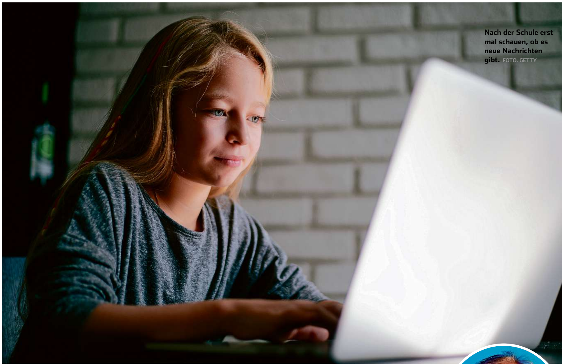
Nach der Schule erst mal schauen, ob es neue Nachrichten gibt.