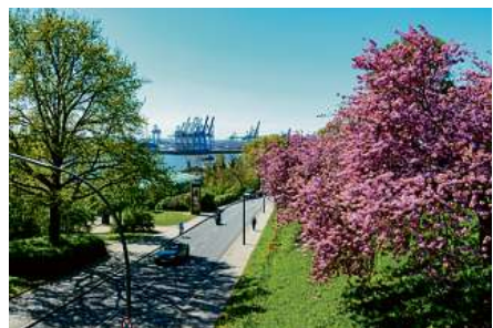
Zierkirschen blühen am Altonaer Balkon.

Apropos Grünanlagen: Wer gut zu Fuß ist, sollte mal die Elbchaussee hinunter bis Blankenese laufen. Da gibt es links und rechts viele schöne Grünanlagen; zunächst den Donners Park, dann den Rosengarten oberhalb des Museumshafens Oevelgönne und Schröders Elbpark. Dahinter liegt einer der schönsten Hamburgs, der Jenischpark, schließlich folgen noch der Wesselhoefpark und der Hirschpark. han