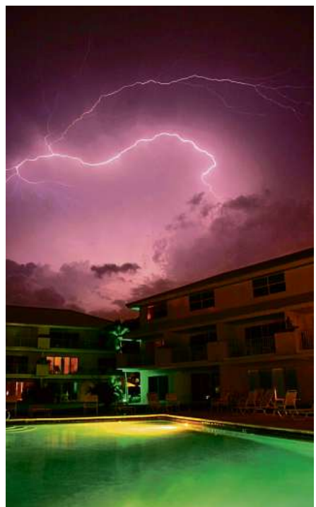
Ein Blitz am Himmel: Baden darf jetzt keiner im Pool.

Aber gilt es auch fürs Baden oder Duschen zu Hause, wie manchmal behauptet wird? Das hängt vom Gebäude beziehungsweise von dem Zustand der Leitungen und Rohre ab. Wenn alle professionell installiert sind, haben sie auch einen Blitzschutz. Und dann darf man auch bei Gewitter baden oder duschen.